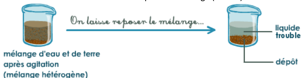
Doc. 1. Principe de la décantation.

La décantation consiste seulement à laisser reposer le mélange (doc. 1.) :