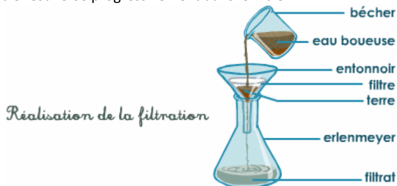
Doc. 3. Principe de la filtration.

Le mélange à filtrer est versé progressivement dans le filtre :